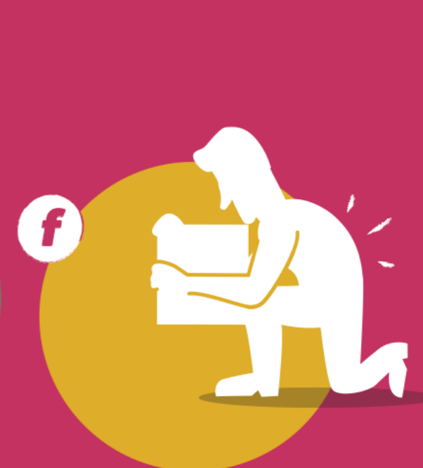
Movilizar cargas en forma incorrecta