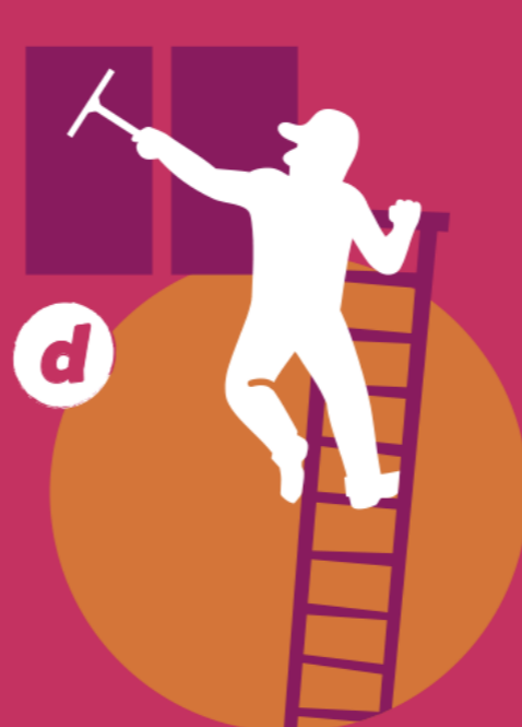
Ascender y descender sin apoyos