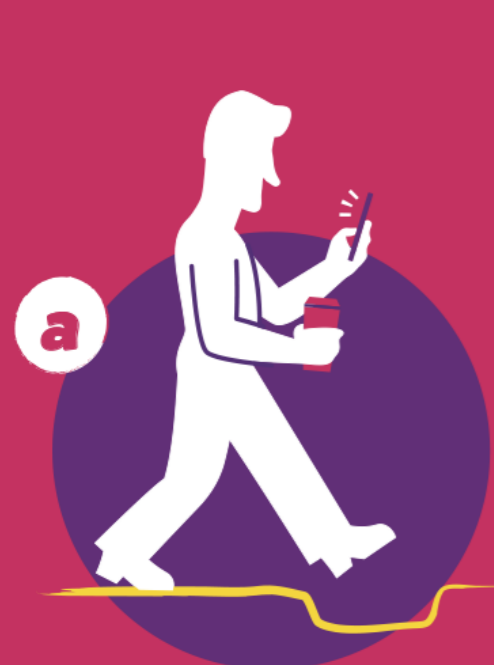
Falta de atención en el camino/pérdida de campo visual