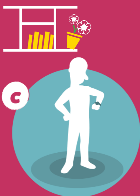
Ubicarse en el lugar incorrecto