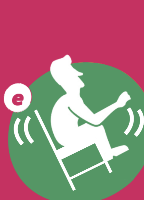
Sentarse de forma inadecuada