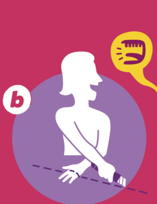
Perder de vista las manos y el punto de contacto